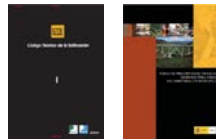
ACTUALIZACIÓN CTE y PG-3

De PREMETI destacar las siguientes novedades: